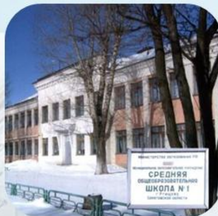
МОУ «СОШ №1 г. Ртищево»